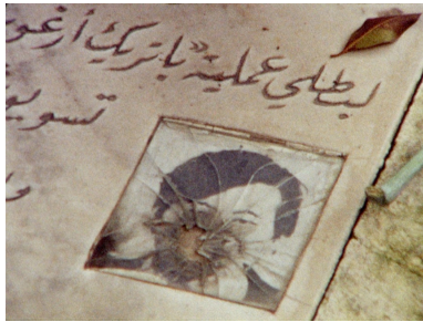
«L&#039;anabase...»