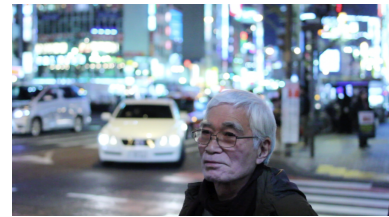
«Il se peut que la beauté ait renforcé notre résolution»