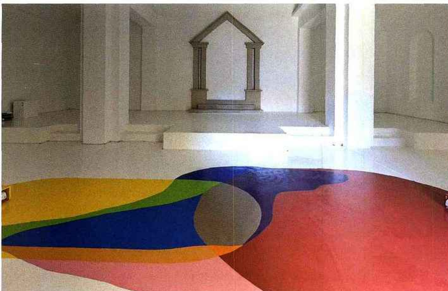
David Hatcher, Score Study (The field of power according to Sentimental Education) , 2010, vue de l'exposition The Barranquilla Principe, centre d'art contemporain - la synagogue de Delme.

Pour le reste, c'est aussi avec le modèle d'exposition que jouent les participants, rappelant si besoin était que les lieux