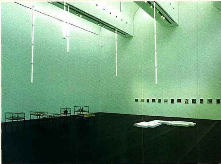
Matti Braun, Özürfa , 2008, vue de l'installation au Museum Ludwig, Cologne, courtesy Galerie BQ, Cologne. © Photo : Lothar Schnepf.