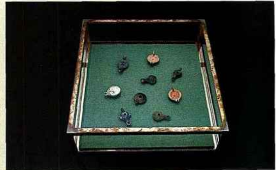
Matti Braun, Sans titre , 2008, neuf lampes à huile antiques, vitrine, 95,8 x 84 x 88,2 cm, courtesy Galerie BQ, Cologne. © Photo : Lothar Schnepf.