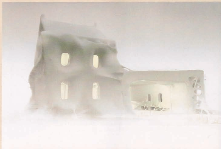
Gue(o)st House , projet pour la commande publique de La Synagogue à Delme, 2010 (©GAËTAN ROBILLARD).